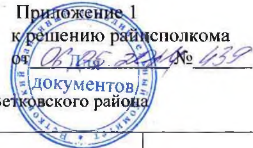
График-схема вывоза и размещения отходов в населенных пунктах г. Ветка и Ветковского района