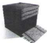
Самодельный деревянный компостер

Компостер можно приобрести готовый, а можно сделать самому