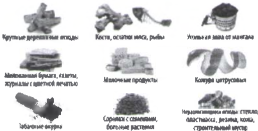
Крупные деревянные отходы Кости, остатки мяса, рыбы Угольная зола от мангала Металлическая бумага, галеты, журналы с цветной печатью Молочные продукты Коммунальные отходы Табачные окурки Сорняки с семенами, большие растения Неразлагаемые отходы: стекло, пластика, резина, кожа, строительный мусор