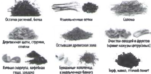
Остатки растений, ботва Изолированные ветки Солома Деревянная щепа, стружка, опилки Остывшая древесная зола Очистки овощей и фруктов (кроме кожуры цитрусовых) Личная скорлупа, кофейная гуща, заварка Бумажные колпачки, измельченная бумага Торф, ил, глиняный помёт

Какие отходы пригодны для компостирования?