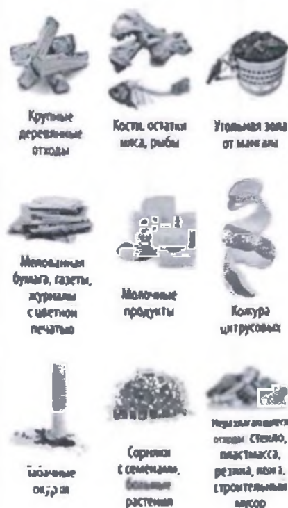
Крупные деревянные отходы