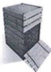
Самодельный деревянный компостер

Компостер можно приобрести готовый, а можно сделать самому