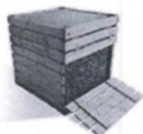
Самодельный деревянный компостер

Компостер можно приобрести готовый, а можно сделать самому