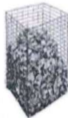
Самодельный компостер из проволоки