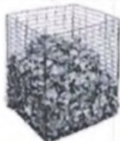
Самодельный компостер из проволоки