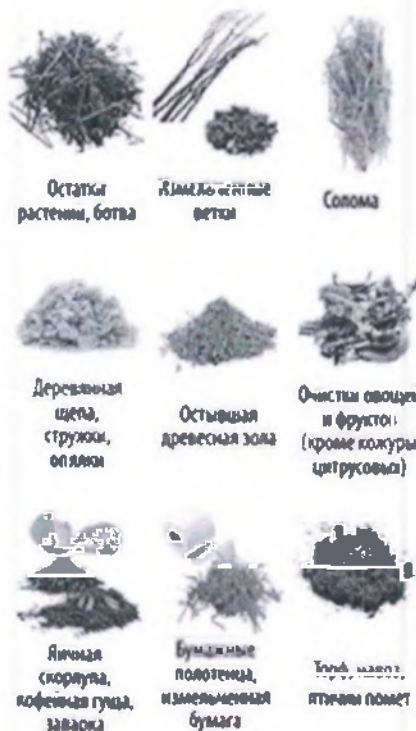
Остатки растений, ботва

Какие отходы пригодны для компостирования?